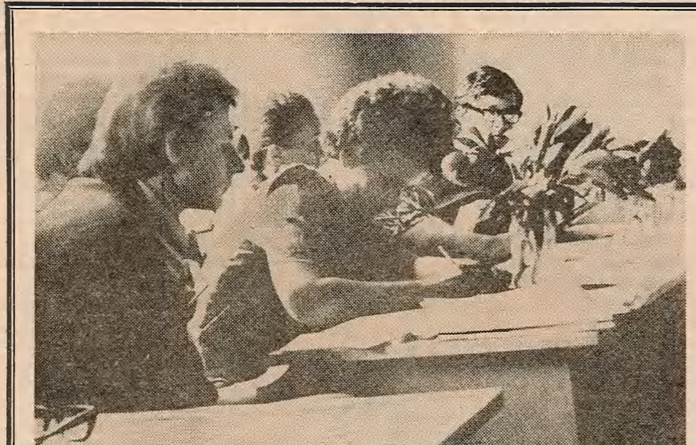
На кафедры агульнага праграмавання студэнты 8-й групы III курса факультэта прыкладнай матэматыкі абараняюць курсавыя работы.