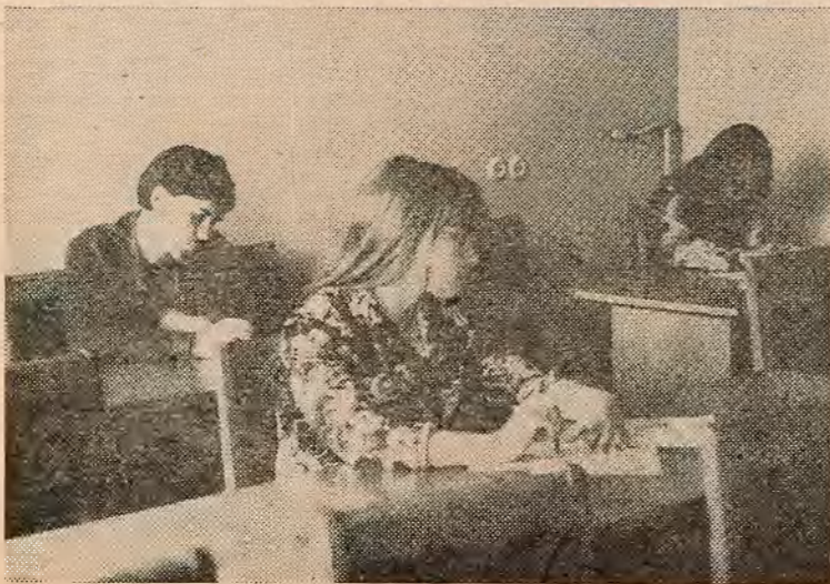
І вось зноў будні чарговага вучэбнага семестра непрыкметна змяніліся сесіяй. Наперадзе засмучэнні і радасці экзаменаў, а зараз свой