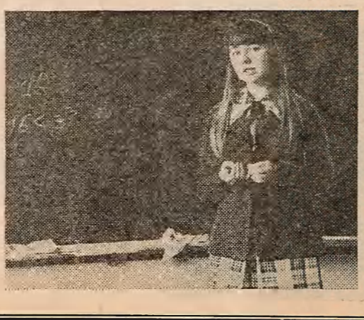
Вучоныя БДУ і Сафій-